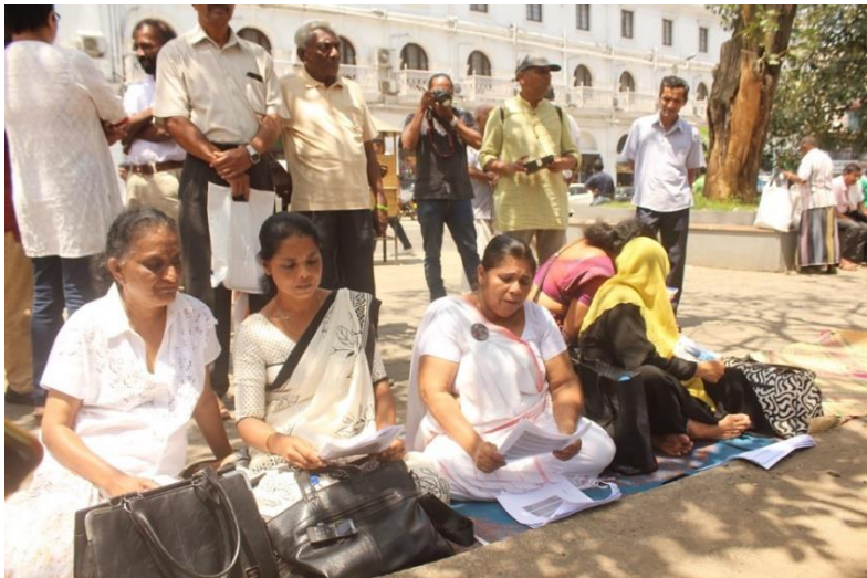
මහනුවර දළදා මාලිගය අබියස සන්ධ්‍යා සහ අතුරුදන්වූවන්ගේ සම්ප ඥාතීන් සඳකිඳුරු ජාතක කාව්‍යය ගායනා කරමින්, 2018 සැප්තැම්බර්.

යුක්තියේ සුසමයාදර්ශීය සංකේතයන් ය. ඇය ඔවුන්ගේ ‘දිව්‍යමය’ සංස්කෘතික බලය ඉල්ලා සිටින විට එසේ කරන්නේ කොටුව දුම්රිය ස්ථානය, අරලියගහ මන්දිරය (අගමැති නිල නිවස) හෝ දළදා මාලිගාව වැනි පොදු ස්ථාන ඉදිරිපිට ය. එසේ කිරීමේදී ඇය ඒවාට සම්බන්ධ ආගමික-සංස්කෘතික වාරිත්‍ර අනුකරණය කරයි.