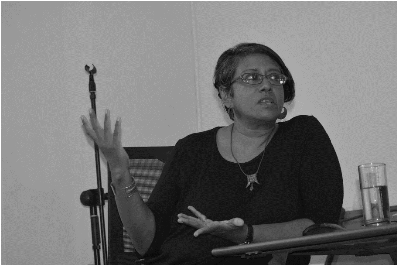
මාලනී ද අල්විස් © දරිද්‍රතා විශ්ලේෂණ කේන්ද්‍රය

වූවා ය: ඒ, Embodied Violence: Communalising Women's Sexuality in South Asia (1996) සහ Casting Pearls: The Women's Franchise Movement in Sri Lanka (2001) ය. Casting Pearls කෘතිය මගින් ලංකාවේ යටත්විජිත යුගයේ අවසන් සමයේ කාන්තා ඡන්ද බල ව්‍යාපාරයේ ඉතිහාසය නිරාවරණය කෙරුණු අතර, Embodied Violence කෘතිය දකුණු ආසියාවේ ඉතා ශීඝ්‍රයෙන් පැතිර යන මූලධර්මවාදයන් ද, ඒ තුළ පවුල ඇතුළු විවිධ සමාජ සංස්ථා ඔස්සේ ස්ත්‍රීන්ගේ ශරීර අවදානමට ලක්වන අයුරුත් විමර්ශනය කිරීම සඳහා ස්ත්‍රීවාදී විද්‍යාර්ථීන් කණ්ඩායමක් එකතු කිරීමට සමත් වුණි.