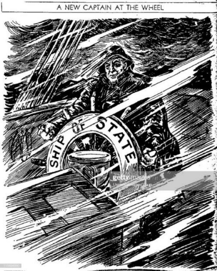
02 රූපය: ‘අළුත් නියමුවෙකු නැව යාත්‍රා කරවයි’ 4

1930 මැද භාගයේදී ඇති වූ ආර්ථික අවපාතය ඇමරිකාවේ විශාල දේශපාලන වෙනස්කම් ඇති කළේ ය. අවපාතයෙන් වසර තුනකට පසු, අර්බුදයට එරෙහිව සටන් කිරීමට ජනාධිපති හර්බට් හුවර්ට නොහැකි බවට