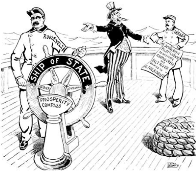
UNCLE SAM: "Thanks, awfully, Alton, but Mr. Roosevelt has proved himself a strong, conservative Pilot, and a change is not desirable."

04 රූපය: 'නියමුවාගේ වෙනසක් සිදු නොවනු ඇත' 6