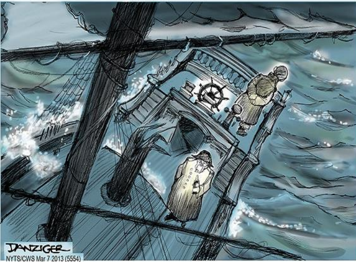
The Ship of State Sails On Despite the Captain and First Mate Not Talking to Each Other

08 රූපය: ‘කපිතාන් සහ පළමු සහකරු එකිනෙකා සමඟ කතා නොකළ ද රාජ්‍ය නැව යාත්‍රා කරයි’ 12