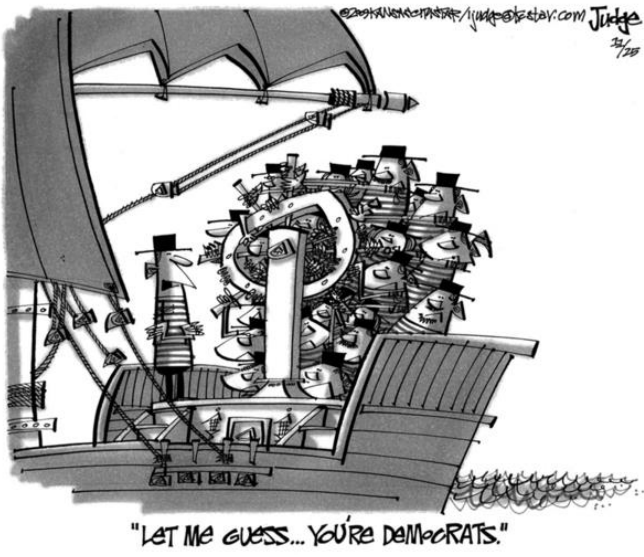
09 රූපය: 'රාජ්‍ය නෞකාව, නැතහොත් නැවෙහි තත්ත්වය' 15

උත්ප්‍රාසය යනු දේශපාලන කාටූන් සඳහා යොදා ගන්නා ප්‍රභලම මෙවලමකි. කාටූන් ශිල්පීන් බොහෝ විට උත්ප්‍රාසය භාවිතා කරන්නේ ප්‍රශ්නයක් සම්බන්ධයෙන් තම මතය ප්‍රකාශ කිරීමට ය. එවන් අවස්ථාවක් 09 රූපයෙන් දැක්වේ.